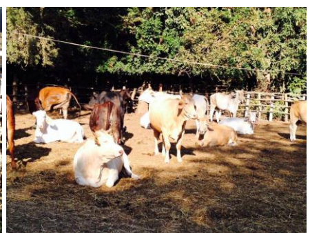
ภาพ,ข่าว : ธนโชค พงษ์ชวลิต / นางสาวชลณฉัตร วินทะไชย ศูนย์สารสนเทศ