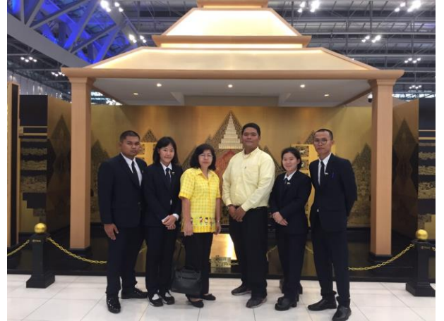
8. ยาวชนเกษตรกรที่เข้าร่วมโครงการฝึกงานผู้นำเยาวชนเกษตรกรไทยในครอบครัวญี่ปุ่น เดินทางกลับประเทศไทย หลังเสร็จสิ้นการฝึกงาน ณ ประเทศญี่ปุ่น เป็นระยะเวลา 11 เดือน (รุ่นที่ 36)