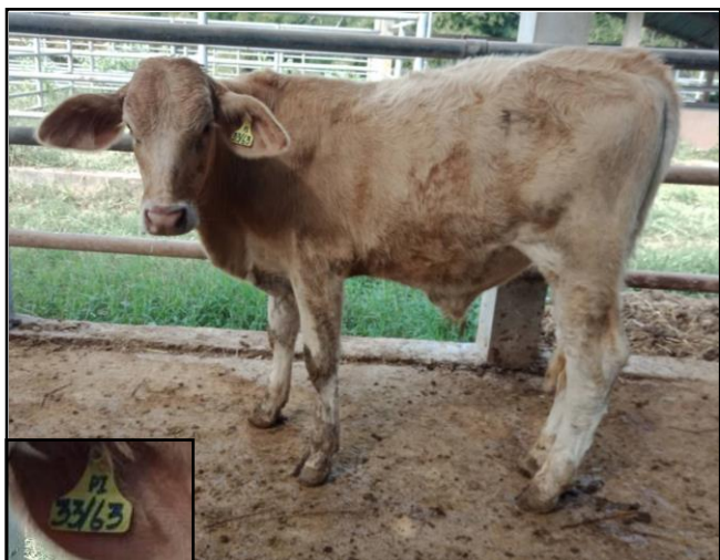
รูปที่ ๗ โคพันธุ์ตาก เพศผู้ หมายเลข ๖๓๐๓๓PI

ขออนุมัติคัดจำหน่ายคัดออก จำหน่ายให้กับเกษตรกรทั่วไป โดยการขายวิธีทอดตลาด แบบประมูลราคาขายตัวด้วยวาจา