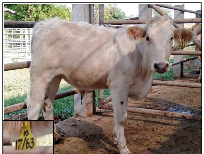
รูปที่ ๖ โคพันธุ์ตาก เพศผู้ หมายเลข ๖๓๐๑๗PI