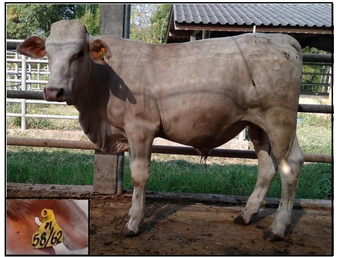
รูปที่ ๒ โคพันธุ์ตาก เพศผู้ หมายเลข ๖๒๐๕๘PI