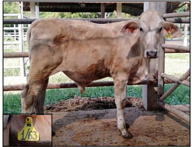
รูปที่ ๒ โคพันธุ์ตาก เพศผู้ หมายเลข ๖๓๐๐๑PI