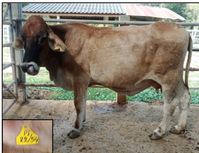
รูปที่ ๑ โคพันธุ์ตาก เพศเมีย หมายเลข ๕๔๐๒๒PI

ขออนุมัติคัดจำหน่ายคัดออก จำหน่ายให้กับเกษตรกรทั่วไป โดยการขายวิธีทอดตลาด แบบประมูลราคารายตัวด้วยวาจา