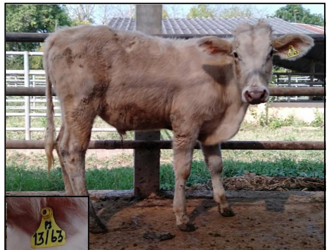
รูปที่ ๔ โคพันธุ์ตาก เพศผู้ หมายเลข ๖๓๐๑๓PI