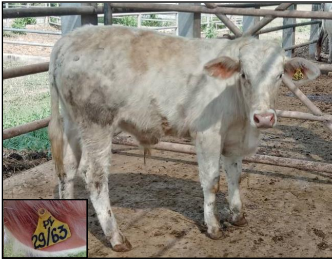
รูปที่ ๗ โคพันธุ์ตาก เพศผู้ หมายเลข ๖๓๐๒๙PI

ภาพถ่ายตามบัญชีหมายเลข ๒ โคพันธุ์ตาก เพศผู้ ๘ ตัว ขออนุมัติตัดจำหน่ายพันธุ์คัดออก จำหน่ายให้กับเกษตรกรทั่วไป โดยการขายวิธีทอดตลาด แบบประมูลราคารายตัวด้วยวาจา