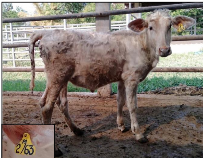
รูปที่ ๓ โคพันธุ์ตาก เพศเมีย หมายเลข ๖๓๐๐๒PI