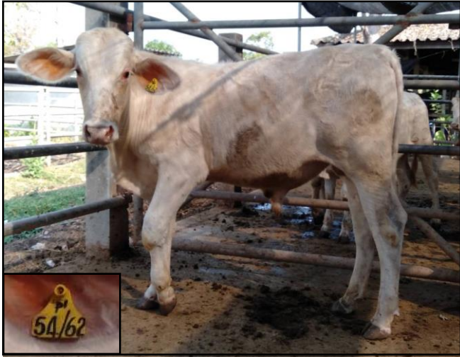
รูปที่ ๑ โคพันธุ์ตาก เพศผู้ หมายเลข ๖๒๐๕๔PI