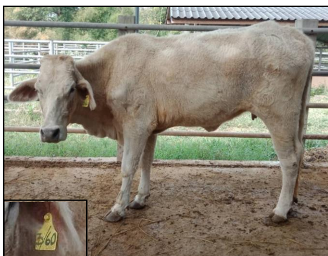
รูปที่ ๓ โคพันธุ์ตาก เพศเมีย หมายเลข ๖๐๐๐๓PI