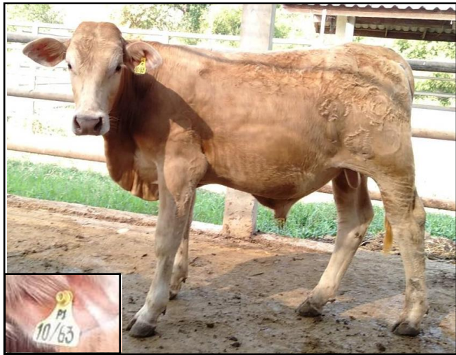
รูปที่ ๓ โคพันธุ์ตาก เพศผู้ หมายเลข ๖๓๐๑๐PI