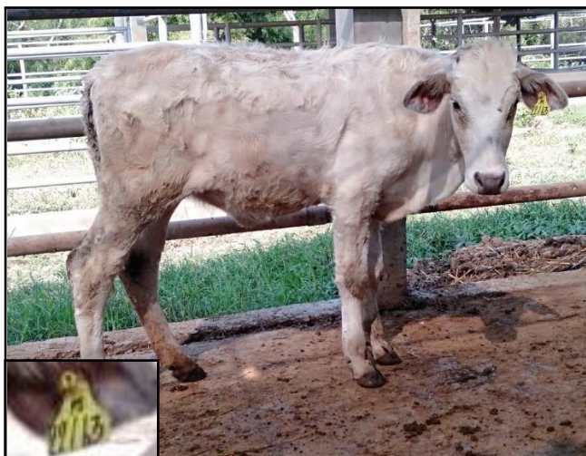
รูปที่ ๕ โคพันธุ์ตาก เพศเมีย หมายเลข ๖๓๐๒๒PI