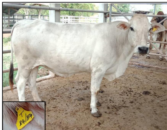
รูปที่ ๒ โคพันธุ์ตาก เพศเมีย หมายเลข ๕๔๐๒๔TAK