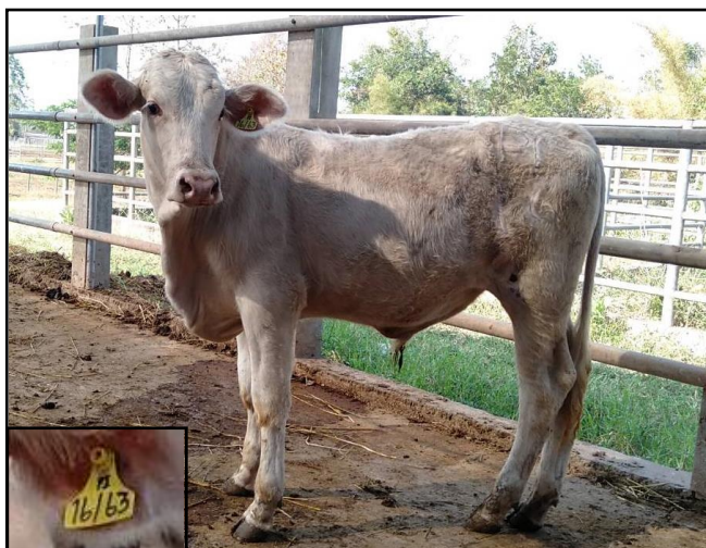
รูปที่ ๕ โคพันธุ์ตาก เพศผู้ หมายเลข ๖๓๐๑๖PI