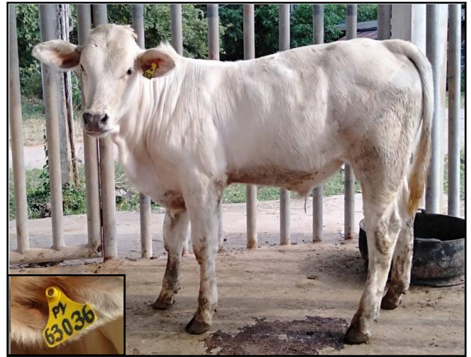
รูปที่ ๘ โคพันธุ์ตาก เพศผู้ หมายเลข ๖๓๐๓๖PI