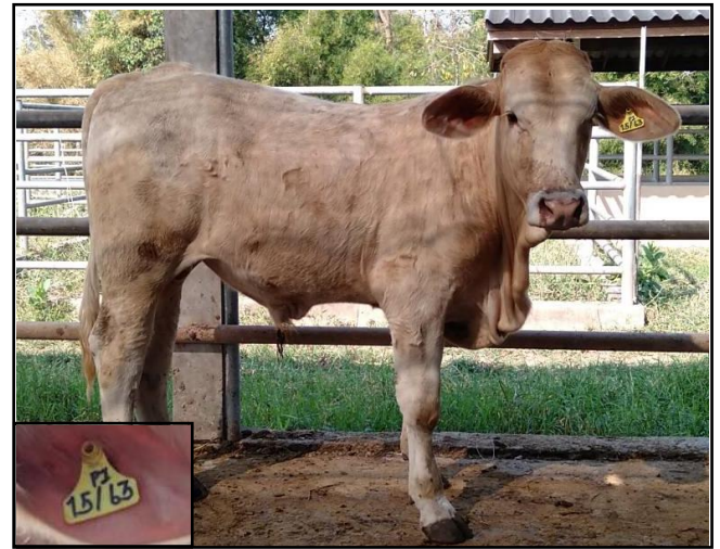
รูปที่ ๔ โคพันธุ์ตาก เพศผู้ หมายเลข ๖๓๐๑๕PI