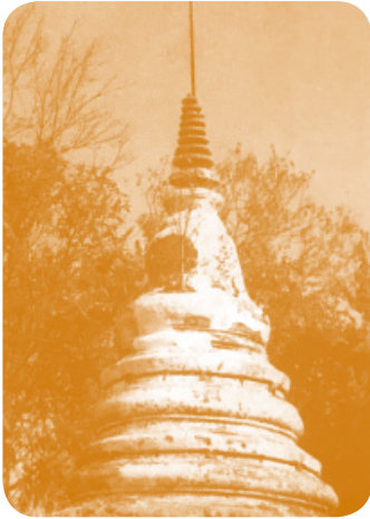
พระเจดีย์ตัน

เป็นคนสร้างนั้นยังหาหลักฐานไม่พบ หลักฐานอีกอย่างหนึ่งเห็นควรนำมารวมกล่าวไว้ด้วยคือ ศิลาคาริก ศิลาคาริกดังกล่าวนี้เหลือแต่เศษหักเป็นชิ้นเล็กรูปขมมเปียกปูน ตัวจาริกเป็นหนังสือขอมอ่านได้เพียงว่า สิลายั ผังดินอยู่ที่ลานพระมณฑป ที่ประดิษฐานพระพุทธรบาท ขุดพบเมื่อคราวปฏิสังขรณ์พระมณฑปราวปี พ.ศ. ๒๔๕๘ ปัจจุบันไม่ทราบวาศิลาคาริกแผ่นนี้อยู่ที่ไหน จึงเป็นที่น่าเสียดายอย่างยิ่งเพราะอาจเป็นหลักฐานเกี่ยวกับความเป็นมาของพระพุทธรบาท ตลอดจนความเป็นมาของวัดเขาบางทราย ในระยะนี้เป็นอย่างดี