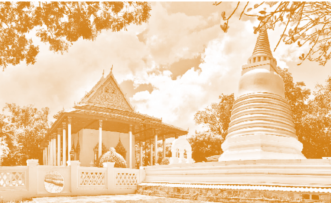
พระอุโบสถและพระเจดีย์ วัดเขาบางทราย ชลบุรี

ข้อความที่เจ้าคุณพระชลโธปมคุณมุนีถวายพระพรพระบาทสมเด็จพระจุลจอมเกล้าเจ้าอยู่หัว รัชกาลที่ ๕ คงหมายถึงเหตุการณ์ตอนนี้ แม้ปีพ.ศ.จะคลาดเคลื่อนกันบ้างก็เพียงเล็กน้อยเท่านั้น จึงเป็นอันได้ความแน่ชัดว่า วัดเขาบางทรายที่ร้างไป สมเด็จพระยาบรมมหาประยูรวงศ์ เป็นผู้สถาปนาขึ้นใหม่ ยั่งยืนมาจนทุกวันนี้ โดยอาศัยกำลังศรัทธาของพุทธศาสนิกชนช่วยกันทำนุบำรุงตามฐานะ จึงจะขอรวมกล่าวในเรื่องปฏิสังขรณ์ตอนต่อไป